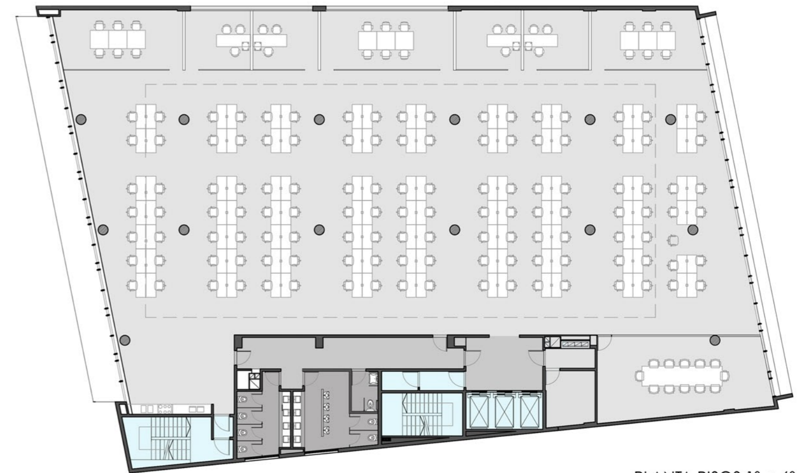
PLANTA PISOS 1º a 6º

ESPACIOS COMUNES 43 M2 ALFOMBRA 835 M2 CIRCULACIONES 43 M2 SANITARIOS Y ANEXOS 75 M2 SUP. RENTABLE 971 M2